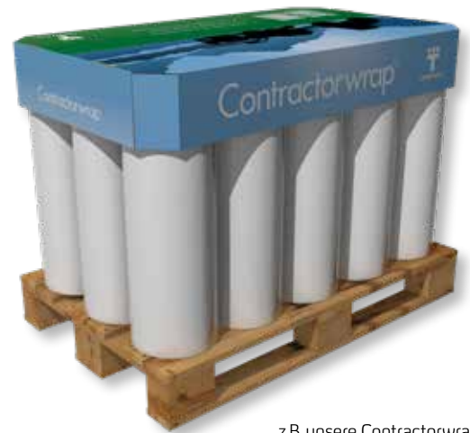
z.B. unsere Contractorwrap® - Verpackung ohne Karton für weniger Abfall und erleichtertes Rollenhandling

Darüber hinaus arbeiten wir kontinuierlich daran, so wenig Material wie möglich in unseren Produktverpackungen zu verwenden, ohne dabei die Qualität zu beeinträchtigen.